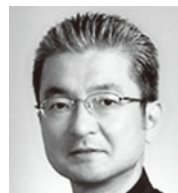
澤端 喜明 (さわはた よしあき)

(元NHK前橋放送局アナウンサー 現在はテレビ朝日「モーニングバード」内TVCM テレビ東京「Tokyoホット情報」キャスター等に出演中)