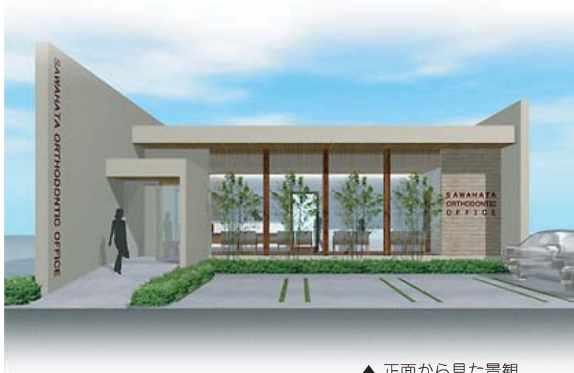
▲ 正面から見た景観